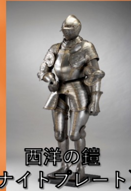
西洋の鎧 (ナイトプレート)