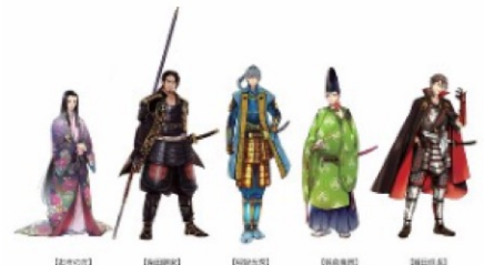
福井県ゆかりの戦国キャラクター

毎日新聞 2020年1月23日 19時06分 (最終更新 1月23日 19時06分)