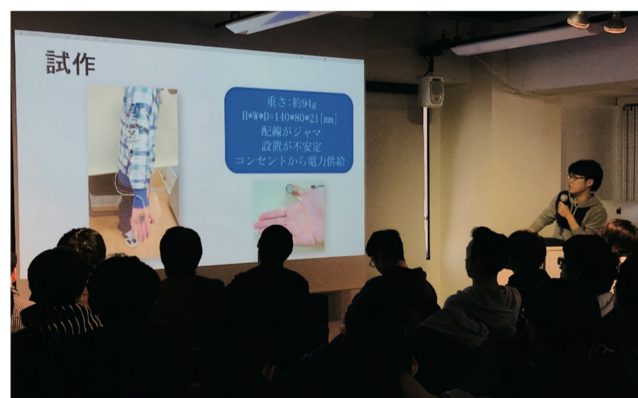
企業様に来校頂き、課題内容の説明や実際の鋏を使っている実演などを体感し、アイデア案を提出