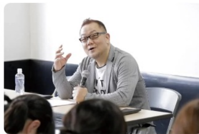
番組制作 元祖爆笑王先生

放送作家。『FNS27時間テレビ』『めちゃ×2イケてるッ!』『爆笑レッドカーペット』などのバラエティー番組制作に携わる。