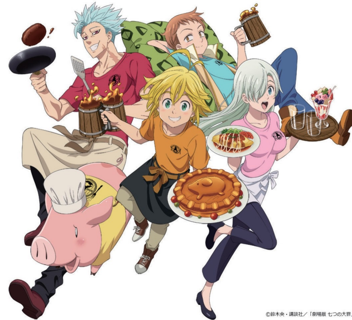
七つの大罪<豚の帽子>亭 Twitter より