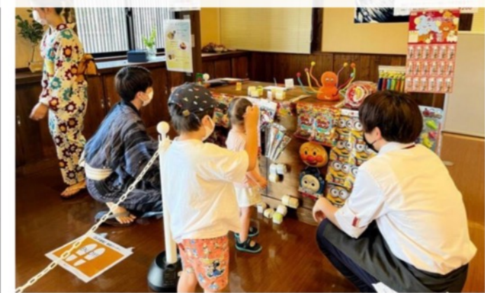
体験メニュー「輪投げ」と「射的」を楽しむ様子