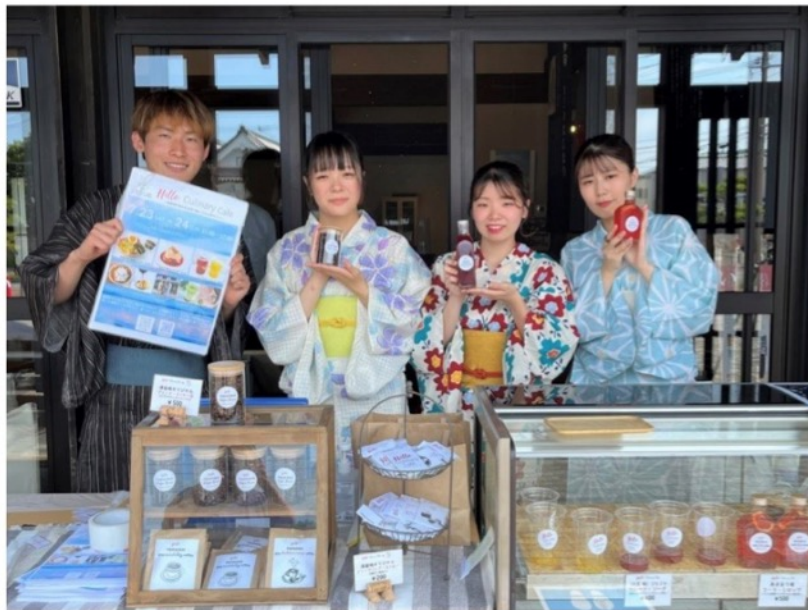
福岡キャリアリー農業・食テクノロジー専門学校カフェ総合科の学生ら