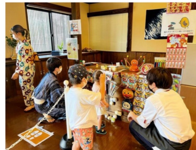
体験メニュー「輪投げ」と「射的」を楽しむ様子